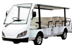
VEICOLI A CORTO RAGGIO