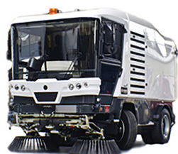
MACCHINE PER PULIZIA